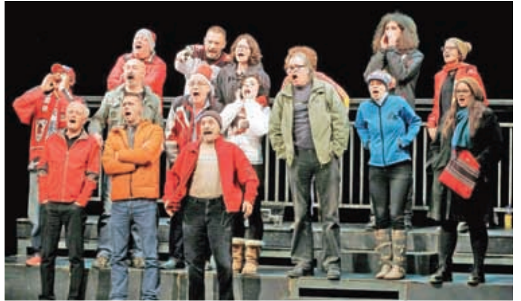
Zmagovalna Zadnja tekma: po mnenju strokovne žirije "izjemen gledališki dogodek v več pogledih"