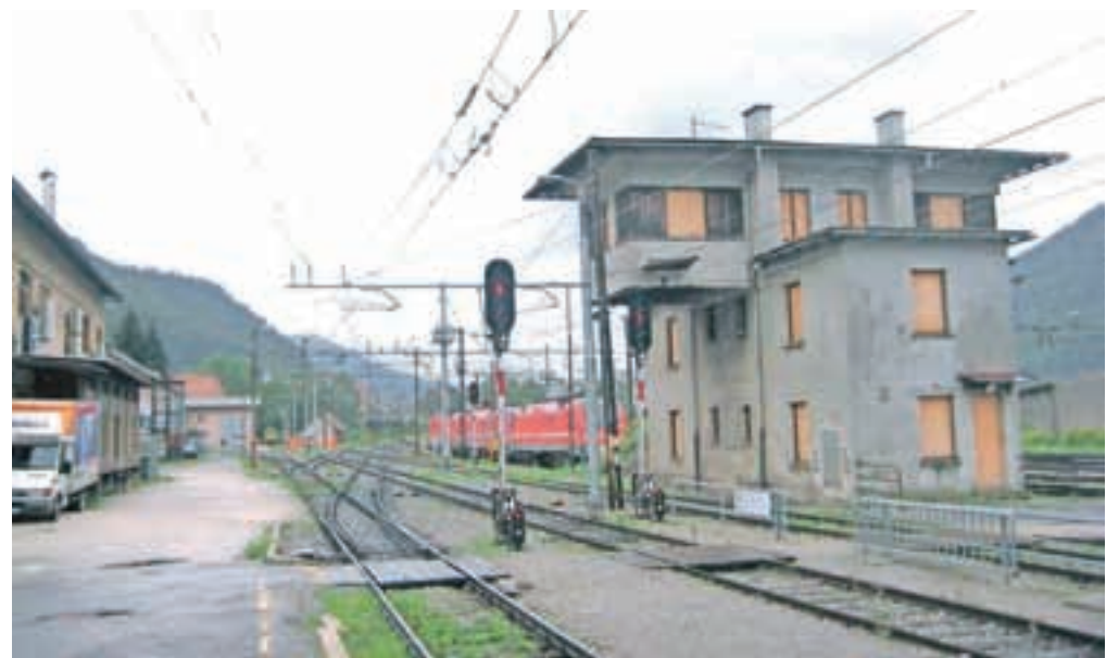
Opuščen kontrolni stolp na železniški postaji

jih je zahteval meddržavni sporazum med Avstrijo in Jugoslavijo iz leta 1976, je postaja živela svoje življenje in ustvarjala izredno razgibano središče. Temu so dajali ton številni domači in tuji potniki, ki so izkoristili običajne polurne postanke za nakup cigaret, časopisov, spominkov ali hitre hrane. Največja gneča je bila ob koncu tedna in med prazniki, ko so delavci iz nekdanjih jugoslovanskih republik, iz Grčije in Turčije obiskovali svoje domače in se ob koncu praznikov vračali nazaj v tujino. Svojem so domov ponavadi prinašali manjša spominska darila, oblačila, tranzistorje, magnetofone, gospodinjske strojčke, fotoaparate, igrače, predvsem pa prihranjen denar, da se je lahko družina preživela. Ko so se vračali v tujino, so bile njihove potovalke in kovčki polni slivovke in domače hrane, pa tudi zaklanih puranov in piščancev ni manjkalo. Le-te so pogosto obesili kar na zunanjo stran oken, da so "preživeli" dolgo pot v tujino. Številni mednarodni tovorni, ekspresni in hitri vlaki (München–Beograd, Hellas ekspres, Akropolis ekspres, Istanbul ekspres, Siplon in drugi) so bili napolnjeni do vrha in prenekateri potniki so na dolgi poti presedeli kar na svojih kovčkih na hodnikih. Mnogo