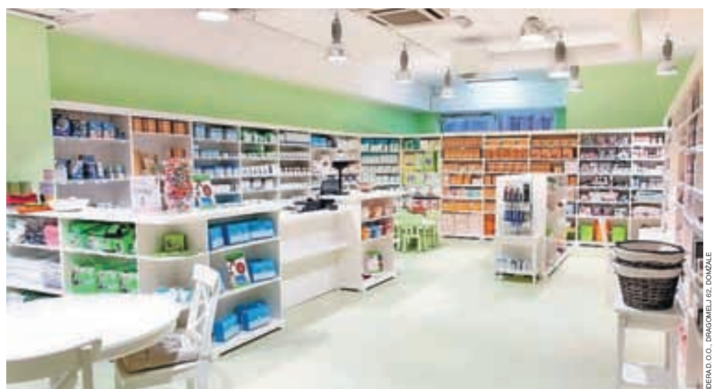
Tosamina Bela štacunca na Jesenicah je odprta vsak dan od ponedeljka do petka med 8. in 20. uro, ob sobotah pa med 8. in 14. uro.

Domžalska Tosama je na Jesenicah, v Supermarketu Tuš, odprla simpatično samopostrežno trgovino v belo-zelenih barvah, imenovano Bela štacunca. To je že osma maloprodajna enota Tosame, za Domžalami in Kranjem tretja na Gorenjskem. "Bela štacunca na Jesenice prinaša ponudbo sanitetnih in higienskih pripomočkov, bogat program za otroke in mamice, paleto naravnih kozmetičnih izdelkov ter izdelkov za hišne ljubljence, dom in vrt. Tosama je tudi lastnica koncesije za prodajo medicinskih pripomočkov, zato so v njej dobrodošli vsi, ki jim je zdravnik izdal naročilnico za kakršenkoli medicinski pripomoček. V prodajalni zaposlene strokovne sodelavke pri nakupu znajo svetovati, občasno pa opravijo tudi meritve krvnega tlaka, ravni krvnega sladkorja in holesterola,