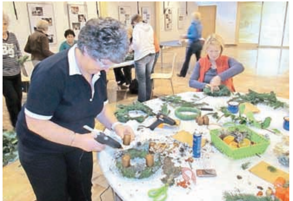
Druga, dopoldanska delavnica izdelovanja adventnih venčkov v Kolpernu