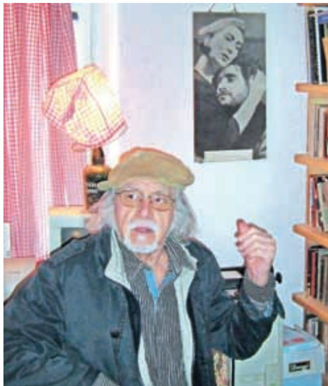
Miha Baloh

je Baloh nepozabno zaznamoval slovensko filmografijo ter "dal stas in obraz slovenskemu novemu valu". Baloh je nastopil v številnih kulturnih filmih, med njimi so Ples v dežju, Maškarada, uveljavil se je tudi v tujini, predvsem v vlogah negativcev. Nastopil je v avstrijski seriji Leni in nemških filmih o Vinetouju. Baloh je bil rojen leta 1928 na Jesenicah, kjer so mu leta 2003 podelili tudi naziv častni občan.