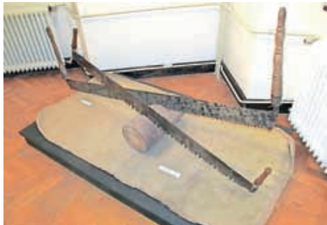
Na ogled je arhivsko gradivo in muzejski predmeti, med njimi denimo žaga amerikanka iz Požgančeve domačije v Mojstrani.