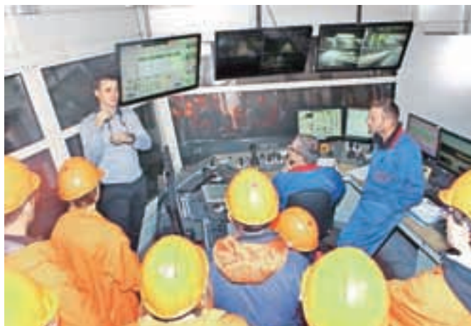
Mladi obiskovalci so bili presenečeni nad načinom dela v "težki industriji", ki ni več niti težka niti umazana.

nutno kažejo največje potrebe predvsem po tako imenovanih deficitarnih poklicih: »Največje povpraševanje je po inženirjih metalurgije, oblikovalcih kovin, električarjih, inženirjih strojništva,